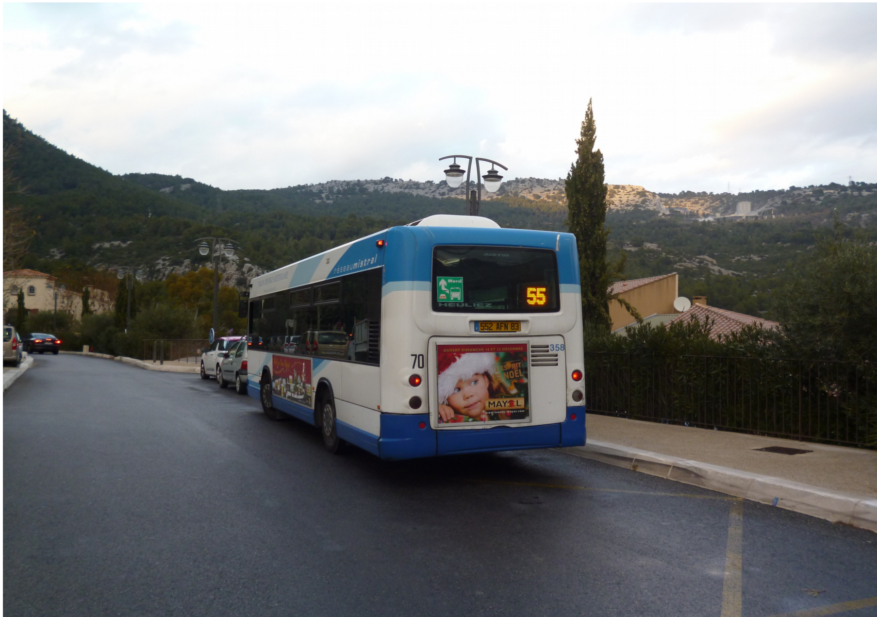
GX117 N°358 en attente au Revest