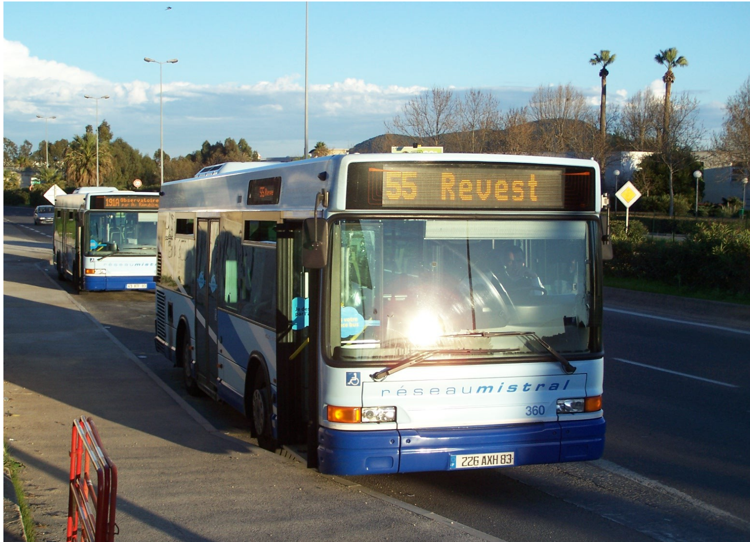
Le 360 en attente de départ à Université Nord

Nous rentrons sur la commune de La Garde pour notre terminus Campus La Garde / La Valette anciennement Université Nord, après un voyage d'une trentaines de minutes environ.