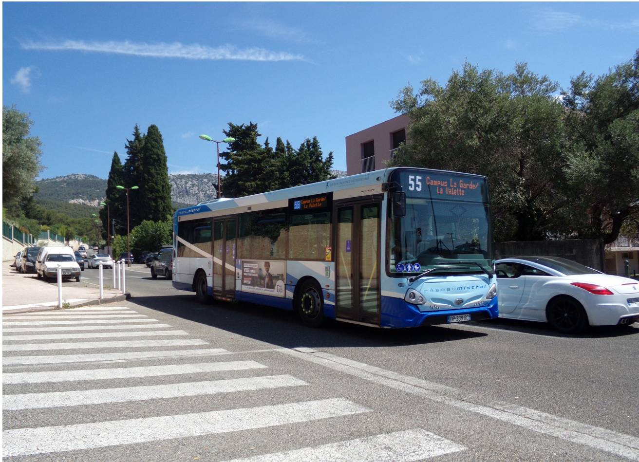
Le 304 venant de passer l'arrêt Minimes direction Campus

A noter qu'aux débuts de la ligne, les 3 premiers arrêts étaient situés Avenue de Sainte Cécile.