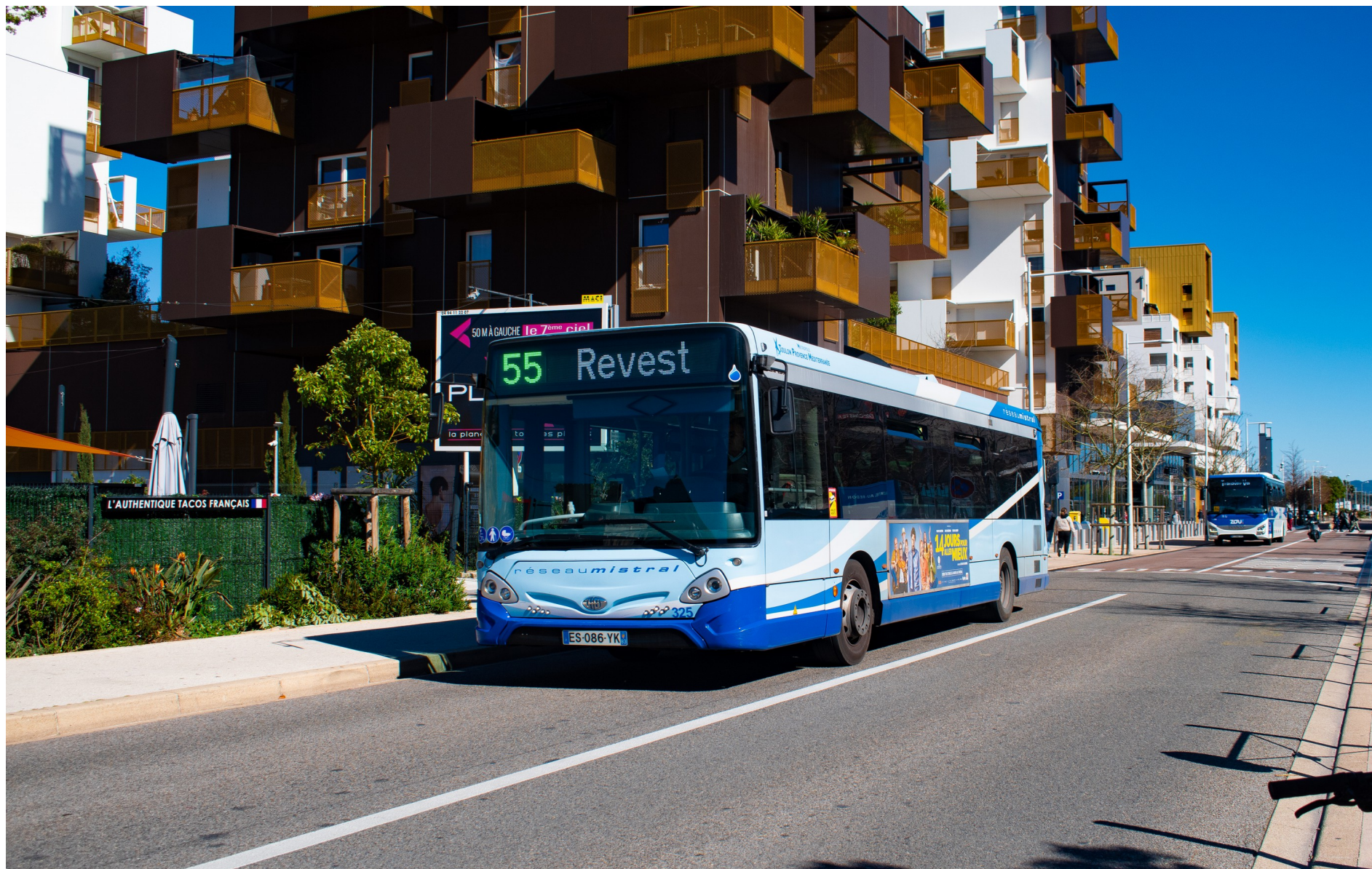
Le 325 venant de passer l'arrêt Avenue de l'Université direction Revest