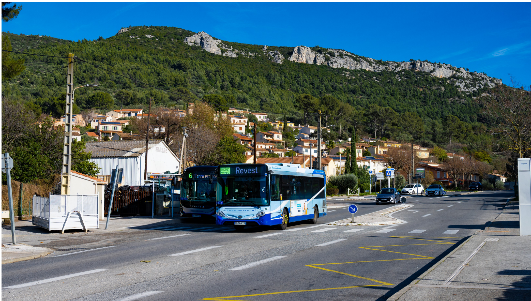
Le 325 à l'arrêt Ripelle direction Revest

Cap plein nord sur la RD46 et la desserte des arrêts La Vierge, Lambert & Ripelle.