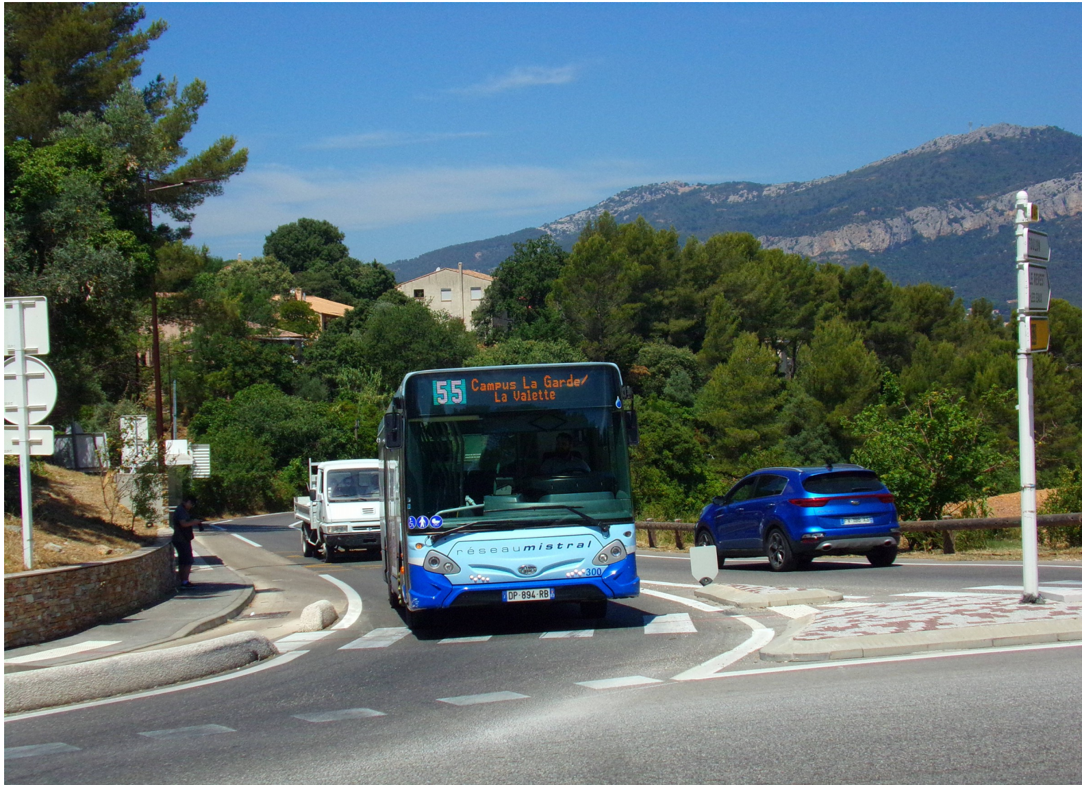
Le 300 passant l'arrêt Favières direction Campus

La civilisation se fait rare et nous arrivons à l'arrêt Résidence Favières avant d'arriver sur la commune de La Valette du Var à l'arrêt Favières.