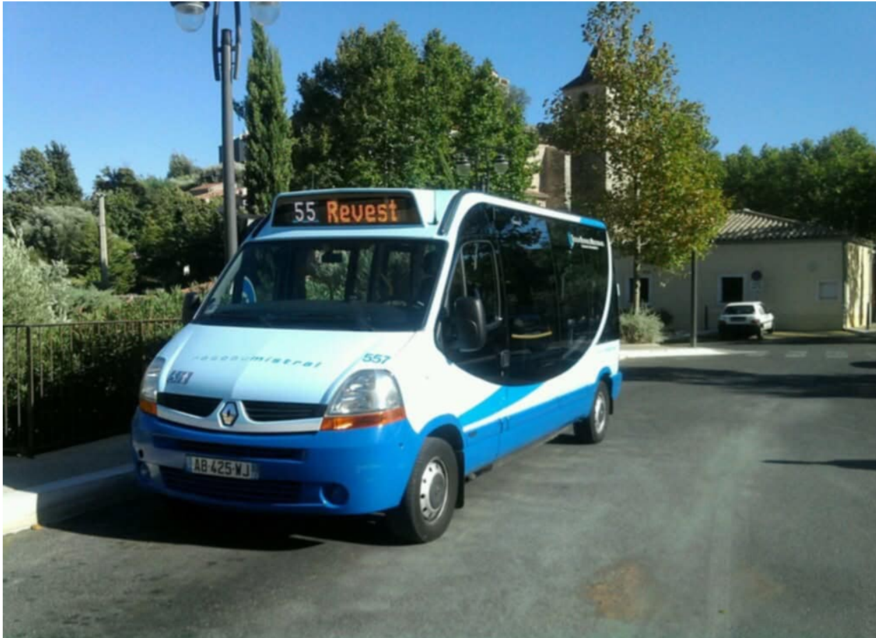
Un été, le 557 à la zone de régulation du Revest

Pour le départ de notre étude de ligne direction la commune du Revest Les Eaux, au nord de Toulon, sur la Boulevard d'Estienne d'Orves au terminus Revest.