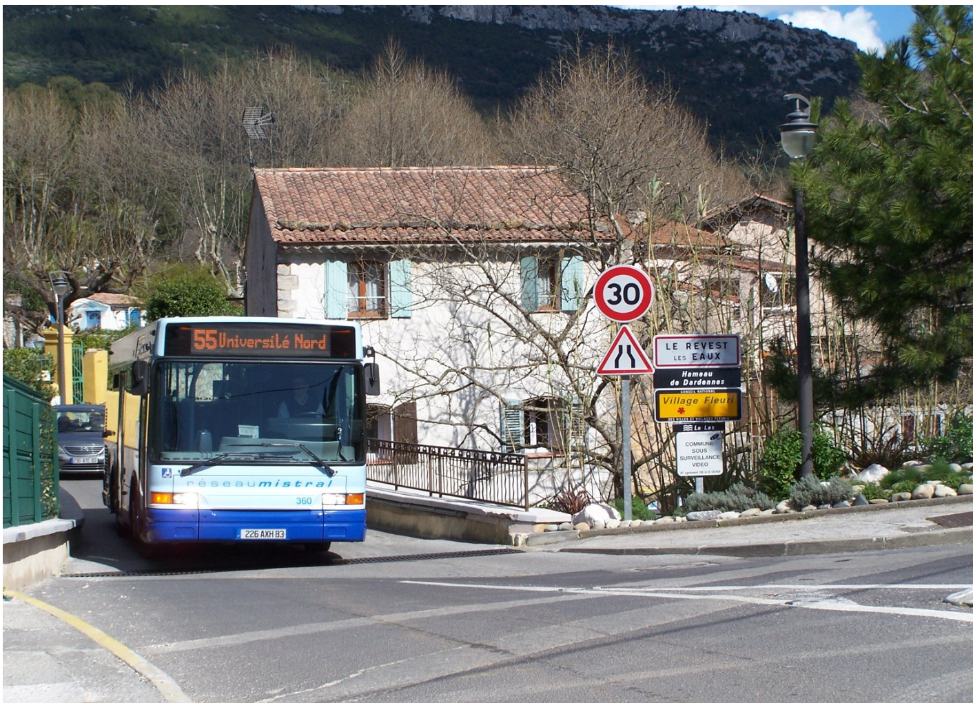
Le 360 arrivant à Hameau Dardennes direction Université Nord

Notre bus prend l'Avenue M. Rouquier & J. Bodino pour rejoindre le Hameau Dardennes et l'arrêt du même nom au niveau de l'étréit pont de Dardennes.