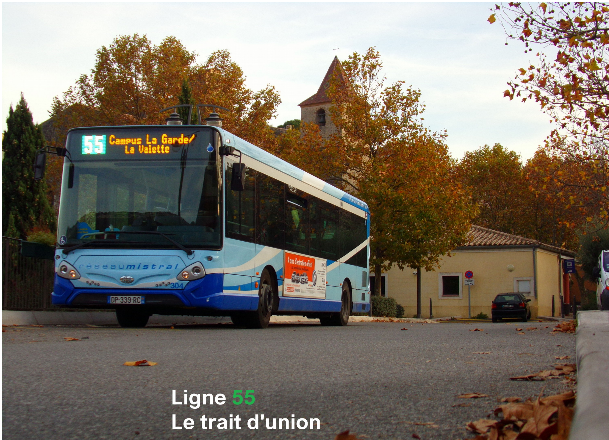
Ligne 55 Le trait d'union