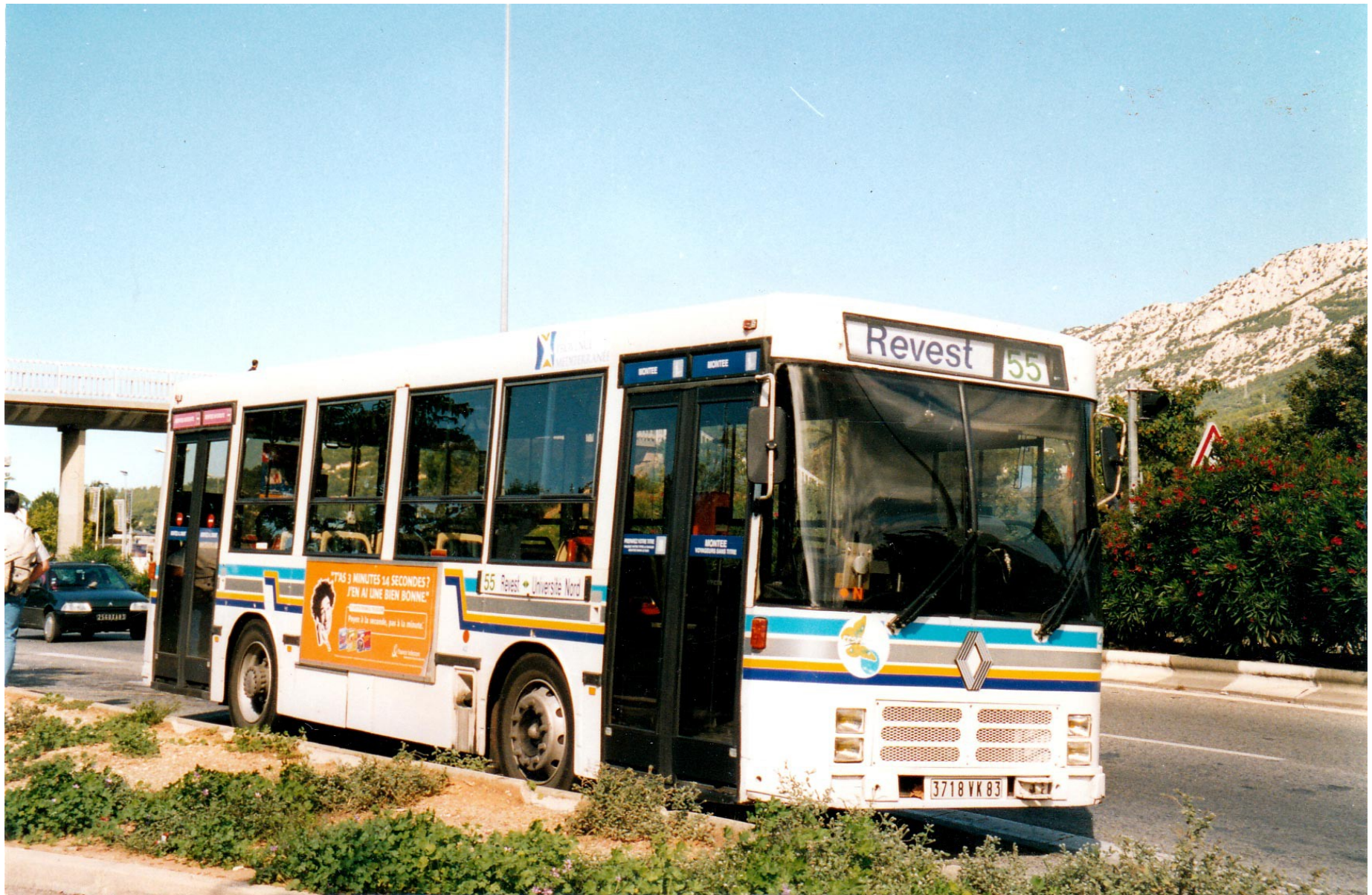
Renault R212 N°42 à Université Nord